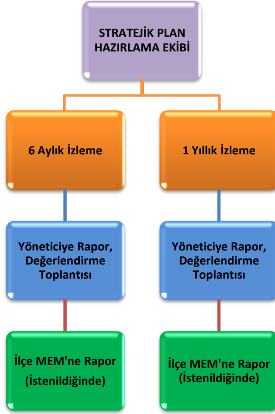
Şekil 4: İzleme ve Değerlendirme Süreci